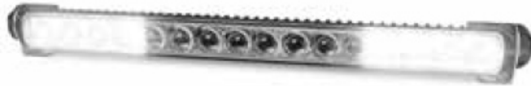
Osvětlení blízkého okolí (široké)