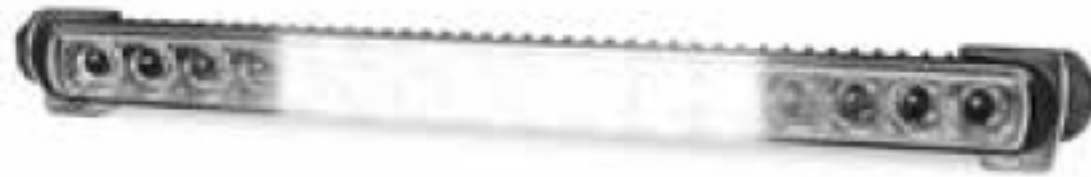
Osvětlení vzdáleného okolí